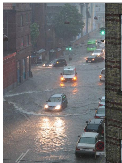
København sommeren 2011.

Populært sagt, kommer vi nu til at betale prisen for manglende opmærksomhed på de miljømæssige konsekvenser af vores levevis. Når vi køber en brugt strømluger af et køleskab, tager bilen til bageren eller vælger det billigste produkt i supermarkedet, er det miljøet og dermed os alle, der betaler prisen. Det være sig udgifter til forhøjede forsikringspræmier, klimatilpasning, oprydning efter olieplatforme, saltvandsforurening af grundvandet osv.