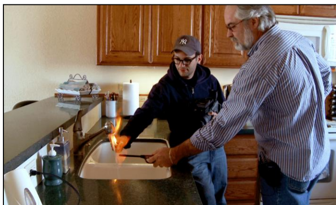
Brændende varmt vand direkte fra hanen.