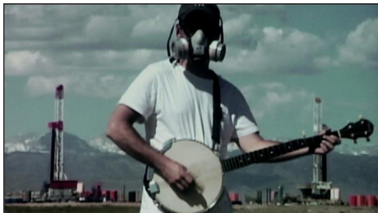
Gas-eventyr i bondeland.

Tirsdag d. 7. februar inviterer Miljøpunkt Amager til en gratis filmforevisning af den prisvindende dokumentarfilm Gasland .